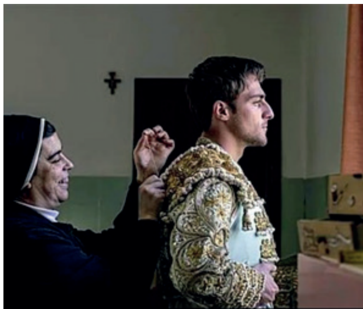
La madre Elisa, cociéndole un trozo de morita que se le había caído al "Niño de las Monjas", antes de salir rumbo a la plaza de toros

N.D.L.M. "Este año voy hacer temporada en Perú y la verdad que me ilusiona muchísimo, me llena de orgullo poder debutar en tierras peruanas y hacer mi presentación como matador de toros, deseo que cada tarde que me vista de tore-