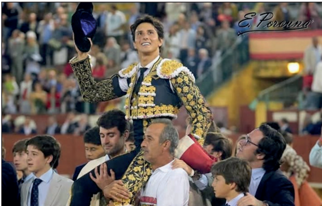
Andrés Roca Rey, el viernes abandona el coso de Jerez en volandas. Saldo artístico cuatro orejas y Puerta Grande, inmejorable reaparición tras su grave cornada en Sevilla.

mostró sereno y templado. Importante final de faena buscando la complicidad de los tendidos. Pinchazo y estocada. Cortó una oreja ganándose la puerta grande." Triunfal retorno a los ruedos de la figura del torero, así apreció al peruano Andrés Roca Rey diario La Colmena: "Hace apenas 23 días nadie en el mundo del toro se atrevía a dar por hecho que Andrés Roca Rey fuera a vestirse de luces este viernes en Jerez de la Frontera. El parte médico de la cornada que sufrió en la Maestranza el 23 de abril hablaba de un boquete severo en el muslo derecho que parecía condenarle a un parón largo. Pero el diestro limeño tenía marcada esta fecha en rojo desde hace meses y no estaba dispuesto a fallarle ni a la Feria del Caballo ni, sobre todo, a quienes ya empezaban a contar los días que le faltaban para llegar a Las Ventas en San Isidro. Lo que ha pasado esta tarde en la plaza jerezana ha hecho saltar por los aires todas las precauciones, todos los temores y, sobre todo, todos los pronósticos prudentes. Porque Roca Rey no se ha limitado a hacer el paseíllo y a salir adelante. Roca Rey ha vuelto cortando cuatro orejas, saliendo a hombros por la puerta grande y dejando una tarde que ya forma parte de la historia reciente de la tauromaquia española. Cuando salió el tercero, Roca Rey ya había encendido a la plaza con un quite «trepidante» trufado de