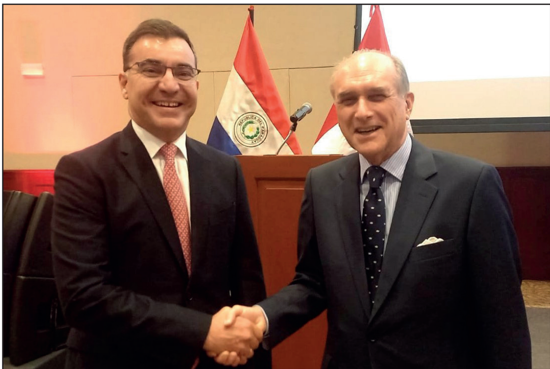
Embajador de Paraguay Octavio Ferreira junto al Ex Canciller - Francisco Tudela en recepción por el 215 Aniversario de la Independencia de la República del Paraguay.