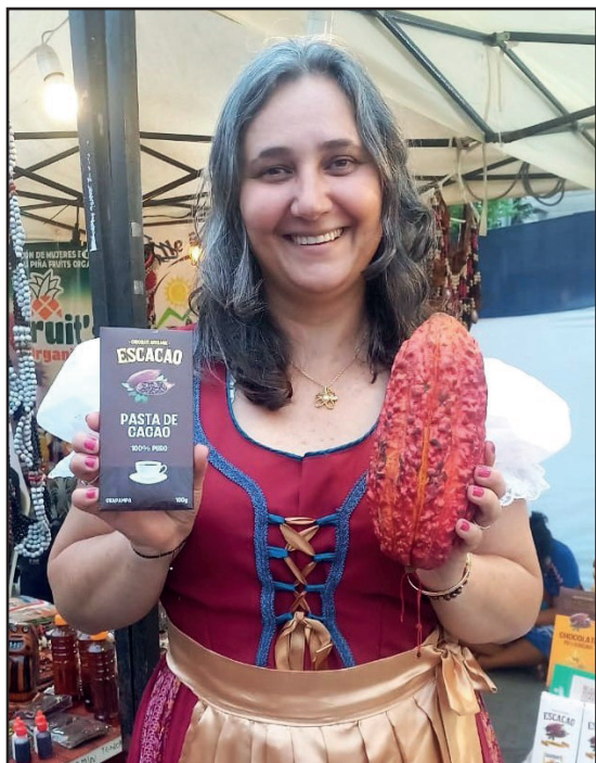
Maria Teresa Doria Egg de Chocolate Artesanal "ESCACAO" de Oxapampa destaca en Expo Semana Turística Selva Central.