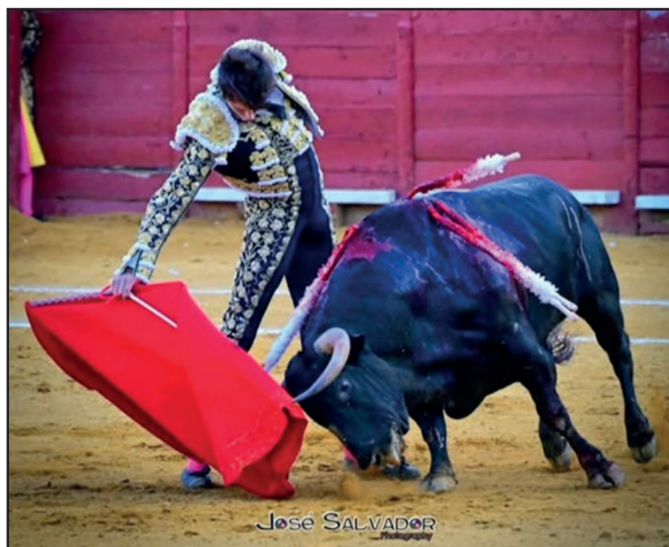
Andrés Roca Rey, el sábado en Talavera un artístico rechazazo. Saldo artístico dos orejas y Puerta Grande. Anunciado y esperado 27 y 28 de junio en la Feria Taurina San Juan Bautista de Chota

la cornada de Sevilla. La faena fue larga, intensa, con toreo a ambas manos sobre un toro «enclasado y rajadito» con aire de Núñez, rematada con unas bernardinas ceñidísimas que preludieron una estocada atravesada. Un descabello fue necesario, pero ya nada podía detener al palco: dos orejas. La plaza temblaba. Y aún quedaba el sexto. Para recibir al sexto toro, Roca Rey se fue