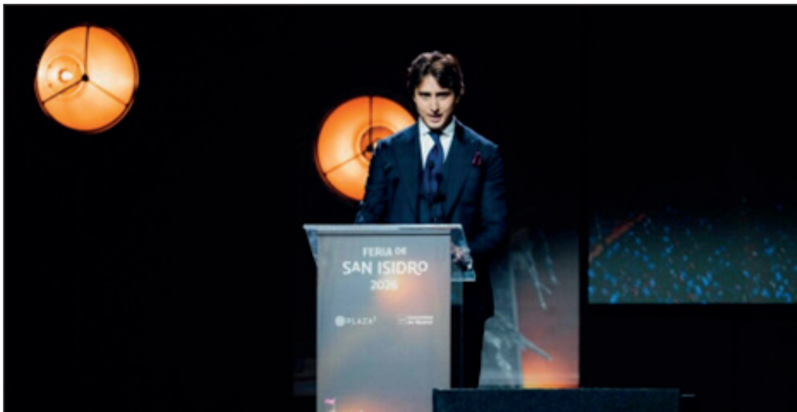
Andrés Roca Rey, anoche en la gala de presentación de la Feria de San Isidro 2026 en Las Ventas.