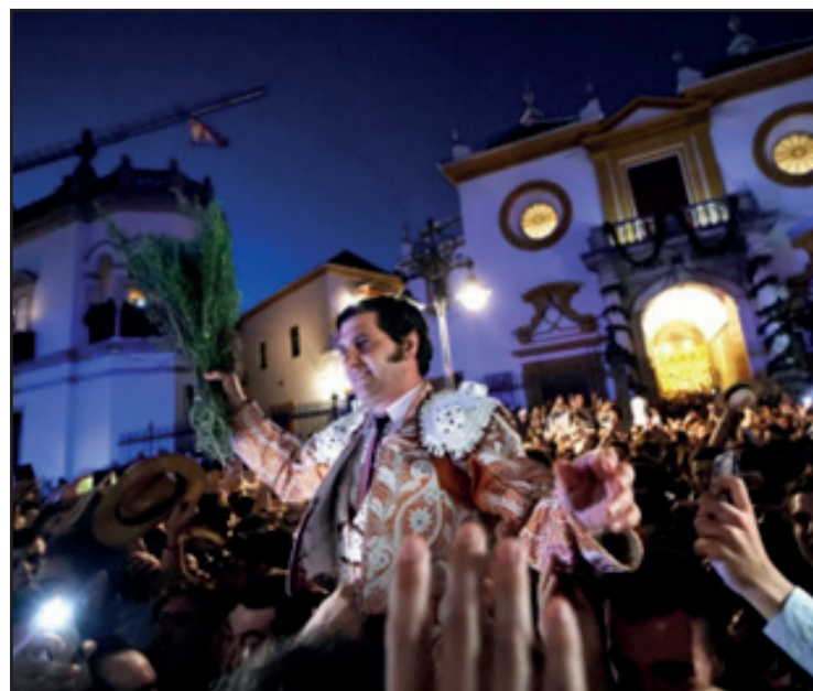
José Antonio "Morante de la Puebla", el jueves en corrida del Corpus Cristi abandona el coso de Sevilla en volandas por la Puerta del Príncipe. Saldo artístico tres orejas.