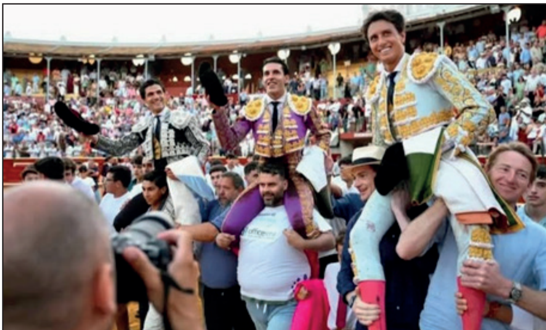
Ayer Puerta Grande en Sanlúcar de Barrameda, para Pablo Aguado, Alejandro Talavante y Andrés Roca Rey. Anunciado y esperado el diestro peruano los días 27 y 28 de junio en Chota, Cajamarca.