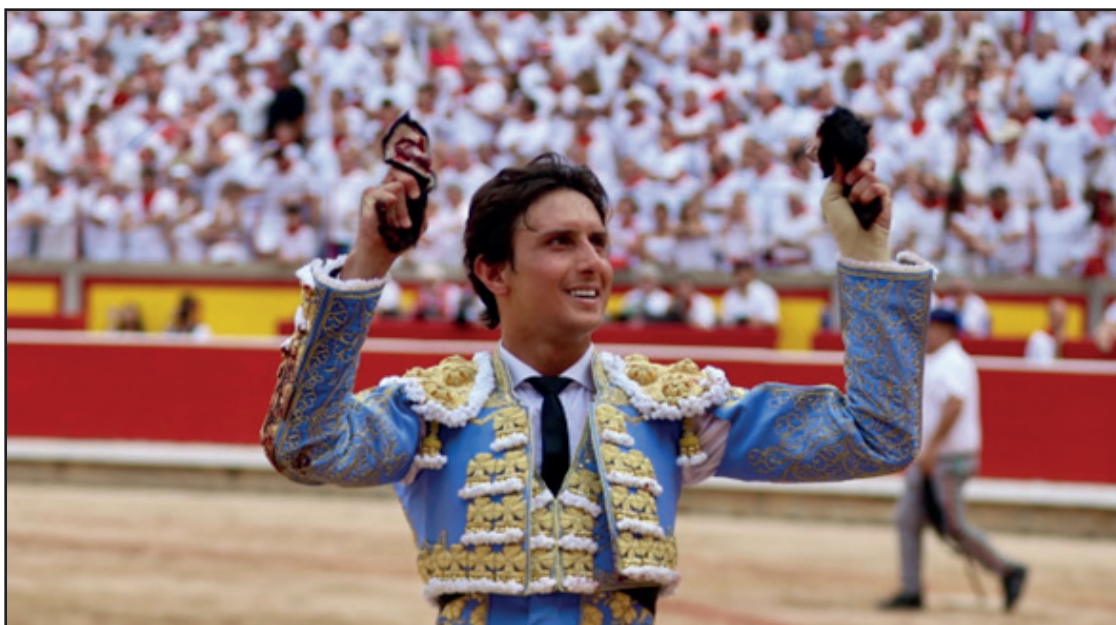
Andrés Roca Rey, ayer dos orejas y vuelta al ruedo triunfal en quinta de Feria del Toro en Pamplona. Saldo artístico dos orejas y Puerta Grande