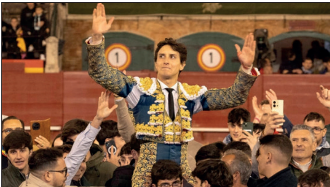
Andrés Roca Rey, el 15 de marzo 2025 Puerta Grande en Fallas de Valencia. Doblete en Valencia 2026 y en Chota 2026.

ANDRÉS ROCA REY EN DIRECTOR CORRIDA DE LA BENEFICEN-