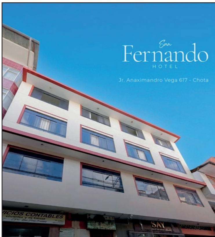
Hotel San Fernando en Chota, el hospedaje de elección para toda la afición taurina del Perú y el mundo en Chota.

de la fiesta brava en el Perú, siempre presentando los mejores ejemplares cada tarde, ya tenemos una serie de contrataciones en diferentes ferias del Perú y esperamos que sigan creciendo, saliendo y consolidándose los compromisos".