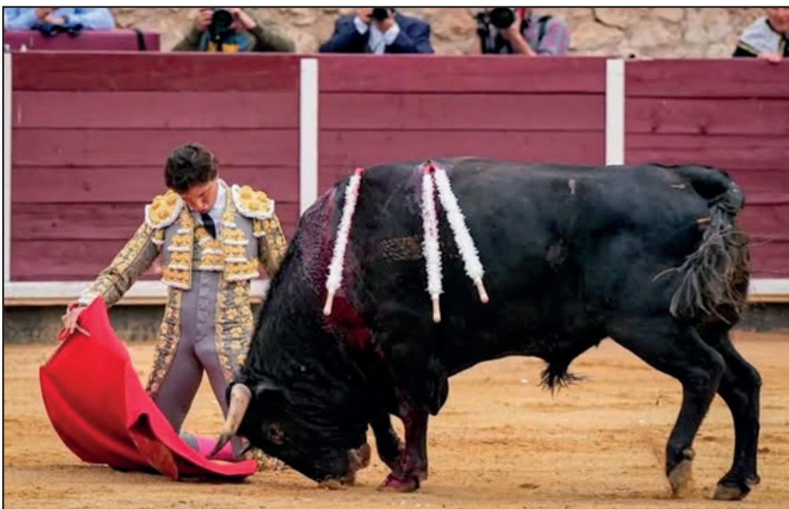
Andrés Roca Rey, el sábado en Brihuega un derechazo de hinojos. Saldo artístico una oreja. Doblete los días 27 y 28 de junio en Feria Taurina San Juan Bautista en Chota 2026.

una faena de poder y mando ante un toro noble, logrando conectar con fuerza con los tendidos y cortando una oreja tras una estocada casi entera. En el sexto, volvió a exponerse en terrenos comprometidos, pero el fallo con la espada le dejó sin premio pese a su entrega".