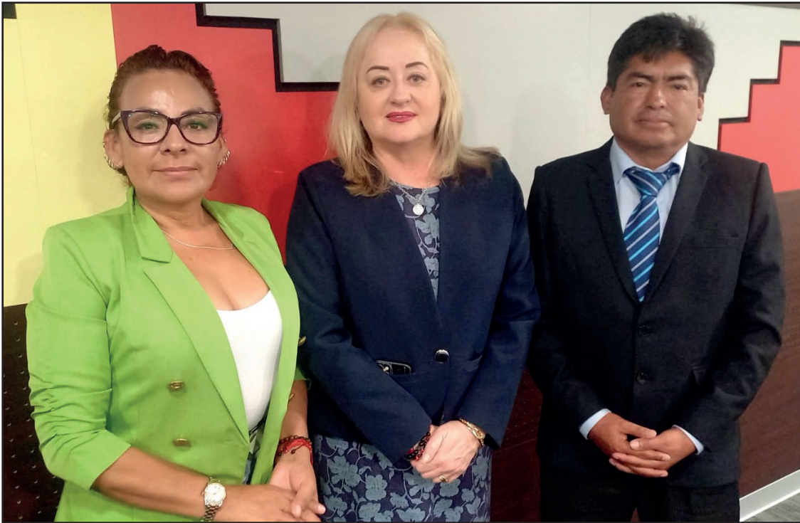
Congresista Kira Alcarraz, Ministra de Cultura Fátima Altabás y Percy Jamanca en reunion técnica sobre el tema del retorno de la Estela de Raymondi al Museo de Chavin en Áncash.