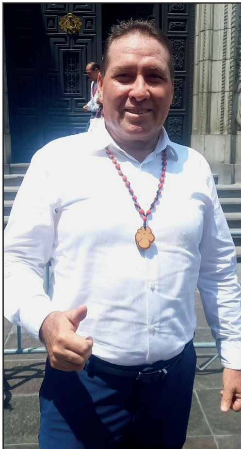
Gobernador Regional de Ucayali Manuel Gambini fue parte del lanzamiento de la Expo Amazónica a realizarse en Cusco del 29 de Abril al 3 de Mayo.