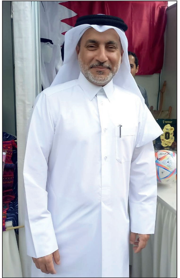
Embajador del Estado de Qatar Abdulla bin Jassim Al Zeyara fue parte de “Expo Embajadas” donde se presento la Cultura y Tradiciones de Qatar.