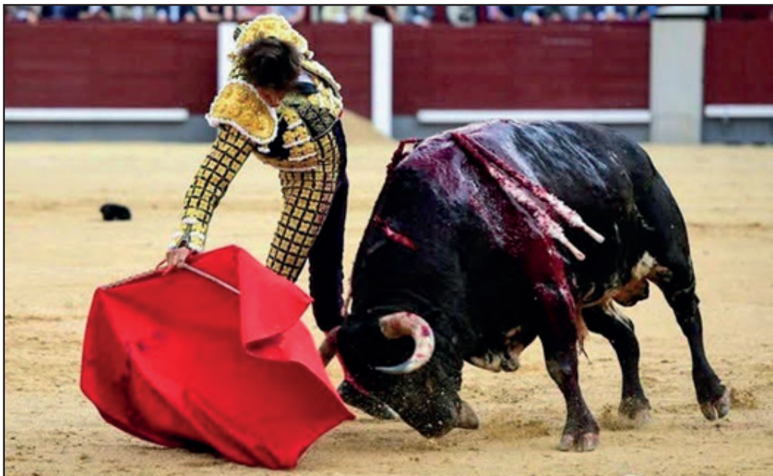
Andrés Roca Rey, ayer un derechazo en la Corrida de la Beneficencia en Plaza de Toros Las Ventas, Madrid. Anunciado y esperado los días 27 y 28 de junio en Chota, Cajamarca