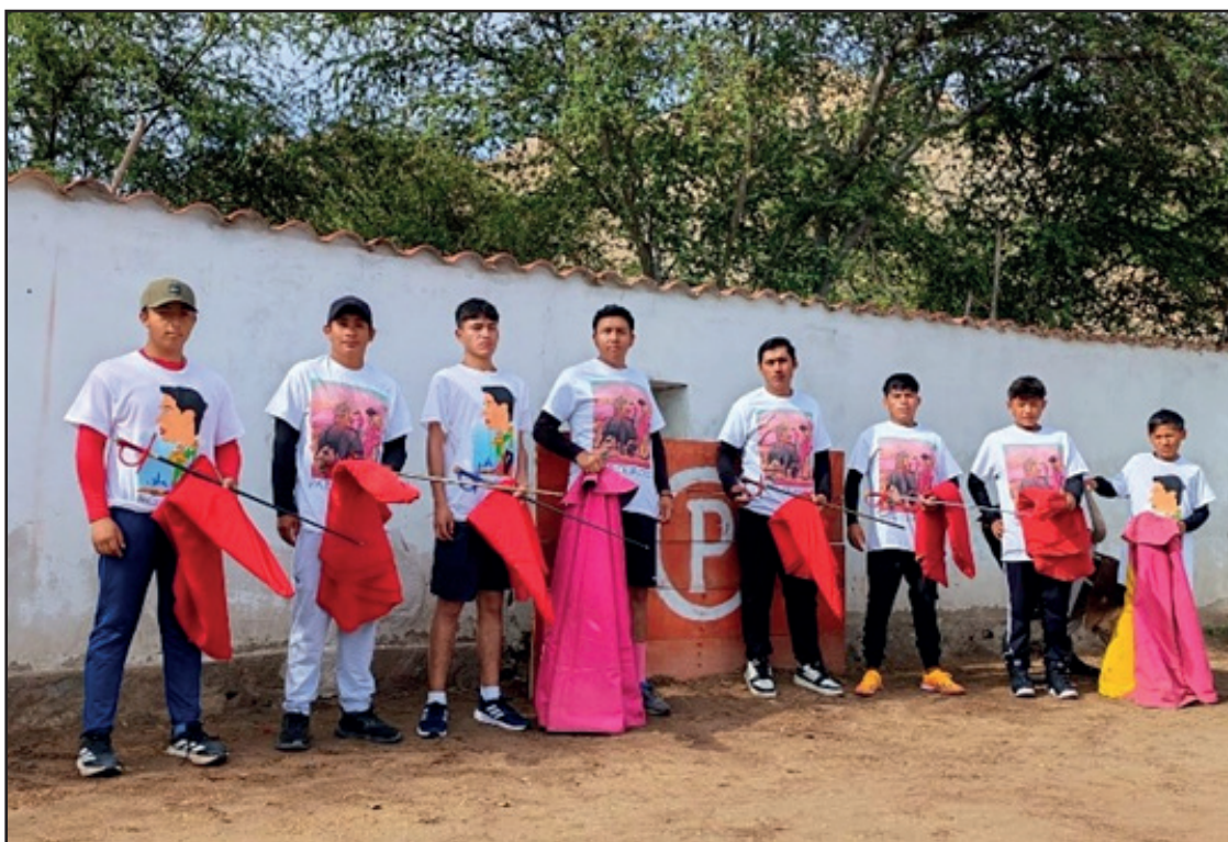
Alumnos de la Escuela Taurina "Paco Céspedes", estarán presentes el domingo 22 de febrero en la Finca Soledad en Chiclayo.

SEBASTIÁN CASTELLA DONA TRAJE DE LUCES QUE VISTIÓ PARA ABRIR LA PUERTA DEL PRÍNCIPE (ESPAÑA). 12 FEB.- El matador de toros francés Sebastián Castella entregó hoy a la Real Maestranza de Caballería de Sevilla el traje de luces que vistió en la corrida del 30 de septiembre de 2023, tarde en la que abrió la Puerta del Príncipe. Acto celebrado en el Salón de Carteles de la plaza de toros y ha contado con la presencia del Teniente Hermano Mayor de la Real Corporación, Marcelo Maestre. El terno, de color grosella y oro, podrá contemplarse en el museo taurino de La Maestranza, donde ya se exhiben otros trajes, como el que donó José María Manzanares tras el indulto de "Arrojado" o el que lució José Antonio "Morante de la Puebla" la tarde que cortó el rabo en Sevilla.