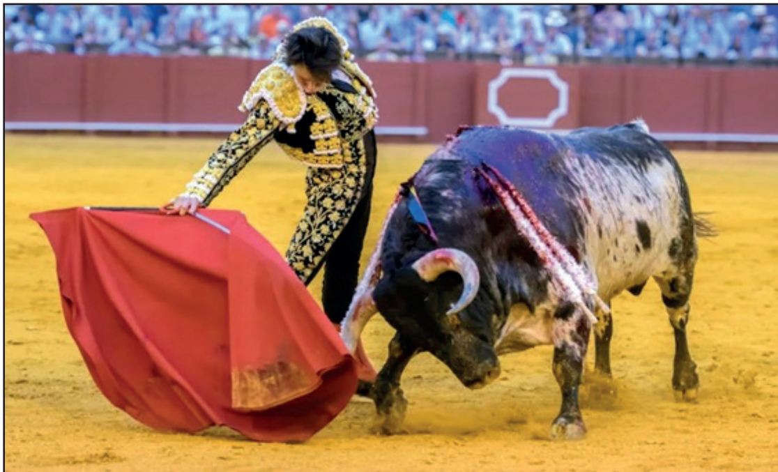
Andrés Roca Rey, un derechazo en la Real Maestranza de Caballería en Sevilla. Que el presidente actuó con honestidad hoy, quizá se una utopía.

ANDRÉS ROCA REY HOY EN SEVILLA TRANSMITIDO POR CANAL SUR (ESPAÑA). 17 ABR.-Canal Sur refuerza su compromiso con la tauromaquia en abierto en un momento clave de la temporada, con la mirada puesta en la preferia sevillana y en el pulso de las principales plazas andaluzas. Tras la celebración del Domingo de Resurrección, la cadena pública andaluza ha intensificado su apuesta por llevar los toros a todos los hogares, consolidando una estrategia que combina grandes carteles, seguimiento informativo y presencia continuada en citas de relevancia. La televisión autonómica estará presente hasta en seis tardes desde la Real Maestranza de Caballería de Sevilla, uno de los escenarios fundamentales del calendario taurino. Una cobertura que no solo refuerza la visibilidad de las figuras, sino que también permite acercar al espectador el ambiente y la liturgia propia del coso del Baratillo en fechas señaladas. En este sentido, Canal Sur se posiciona como uno de los grandes escaparates audiovisuales de la temporada. Festejos que podrán verse a través de Canal Sur esta semana: 17 de abril (18:30h). Real Maestranza de Caballería de Sevilla. Viernes de Pre feria: Toros de "Domingo Hernández",