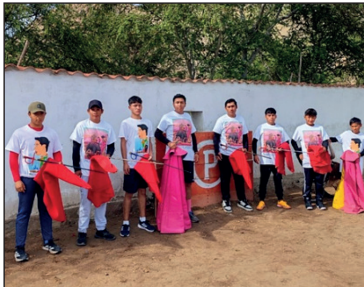
Alumnos del Ciclo 2026 Escuela Taurina Paco Céspedes, el viernes al culminar primera semana de preparación en la Finca Soledad.

VII ANIVERSARIO ASOCIACIÓN CULTURAL TAURINA PEÑA DEL OLVIDO DE CAJABAMBA (PERÚ). 16 ENE.- El domingo 25 de enero partir del mediodía en la plaza de toros "Joselito Rioja", sito en Antigua Panamericana Sur Km. 35,5 Lurín, (Paradero explosivos), en el marco de los actos celebratorios por el VII Aniversario de la Asociación Cultu-