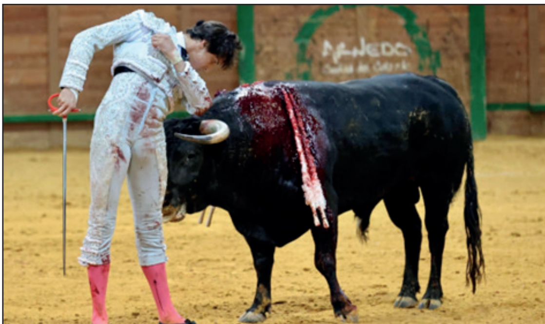
Andrés Roca Rey, el 19 de marzo 2023 un desplante en Arnedo, saldo artístico tres orejas y Puerta Grande. Anunciado y esperado en Arnedo el 22 de marzo.

O.Z. "Mi cuadra de caballos se ha ido formando año tras año. Inicio el año 2017 con mi primer caballo "Chalaco", marcando el inicio de un sueño. Posteriormente adquirí dos potros del criadero BCD de Belisario de las Casas de Donofrio, específicamente BCD "Triano" y BCD "Algecero", ambos con registro y