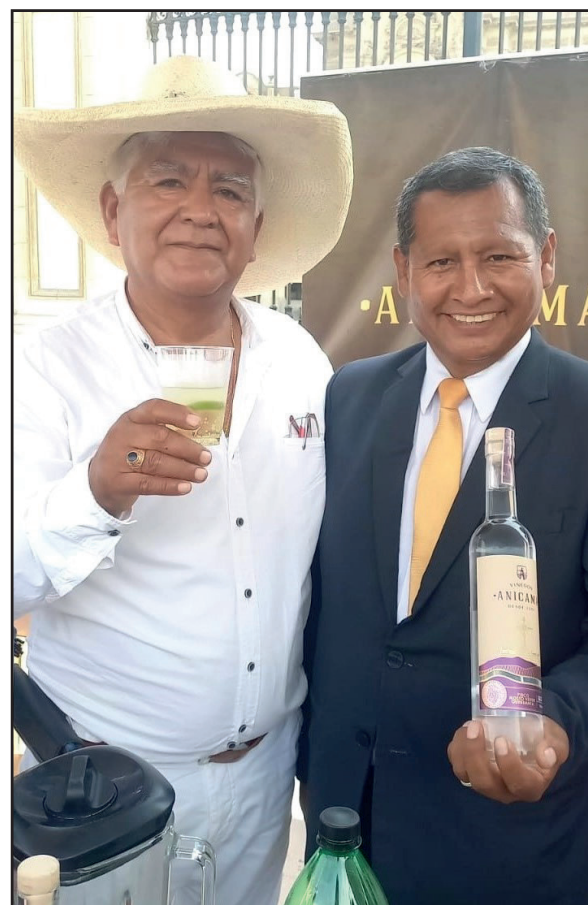
Congresista Ernesto Bustamante fue parte de la presentación "Áncash Mejor Destino de Aventura del Mundo" conjuntamente con Jamanca Tours.