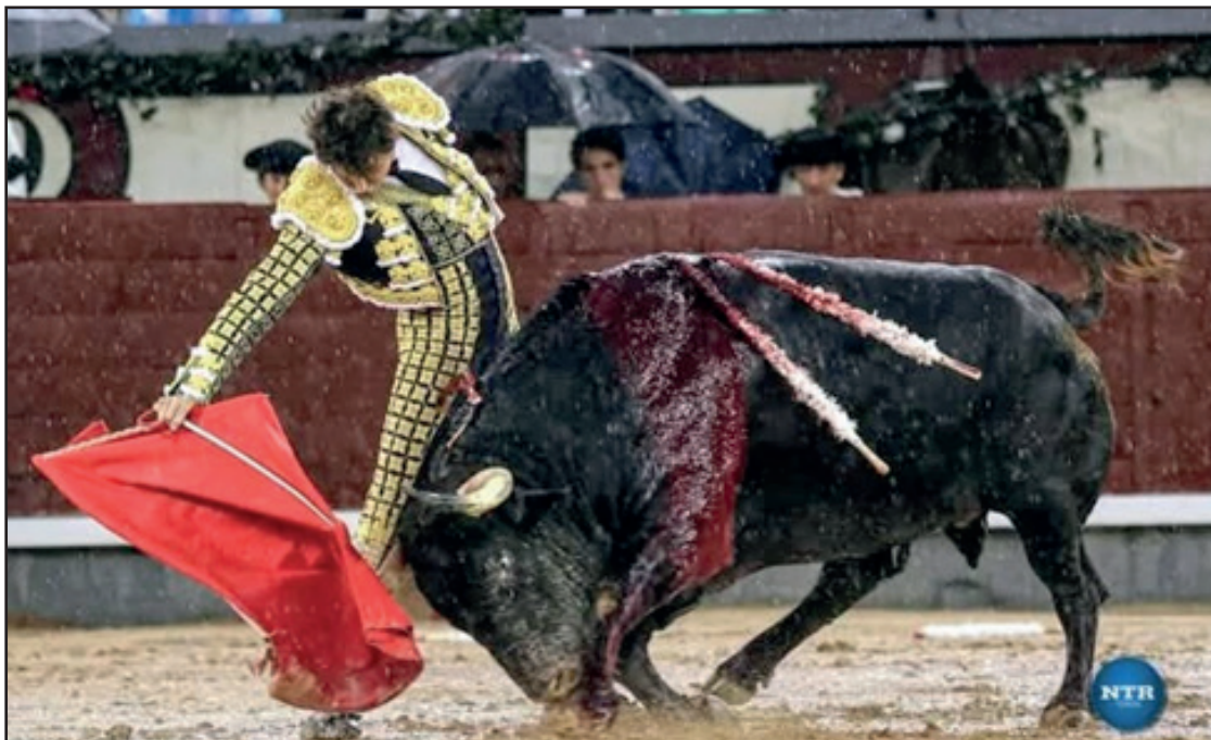
Andrés Roca Rey, el domingo un derechazo en la Corrida de la Beneficencia en plena lluvia torrencial en Las Ventas. Anunciado y esperado los días 27 y 28 de junio en Chota, Cajamarca.

LOCALIDADES SUELTAS PARA LA FERIA TAURINA EN HONOR SAN JUAN BAUTISTA CHOTA 2026 (PERÚ) 19 JUN.- A través de www.platicket.com puede adquirir sus localidades sueltas, aquí el importe: Tendidos de sol: Fila 1. Días 25 y 26 Jun. S/. 250; Días 27 y 28 Jun. S/. 250. Fila 2. Días 25 y 26 Jun. S/. 220; Días 27 y 28 Jun. S/. 270. Fila 3, 4, 5 y 6. Días 25 y 26 Jun. S/. 140; Días 27 y 28 Jun. S/. 170. Fila 7, 8, 9 y 10. Días 25 y 26 Jun. S/. 120; Días 27 y 28 Jun. S/. 150. Fila 11, 12, 13 y 14. Días 25 y 26 Jun. S/. 90; Días 27 y 28 Jun. S/. 110. Fila 15, 16 y 17. Días 25 y 26 Jun. S/. 80; Días 27 y 28 Jun. S/. 100. Fila 18, 19 y 20. Días 25 y 26 Jun. S/. 60; Días 27 y 28 Jun. S/. 80. Fila 21, 22, 23 y 24. Días 25 y 26 Jun. S/. 30; Días 27 y 28 Jun. S/. 40. Tendidos de sombra: Fila 1. Días 25 y 26 Jun. S/. 270; Días 27 y 28 Jun. S/. 330. Fila 2. Días 25 y 26 Jun. S/. 250; Días 27 y 28 Jun. S/. 3100. Fila 3, 4, y