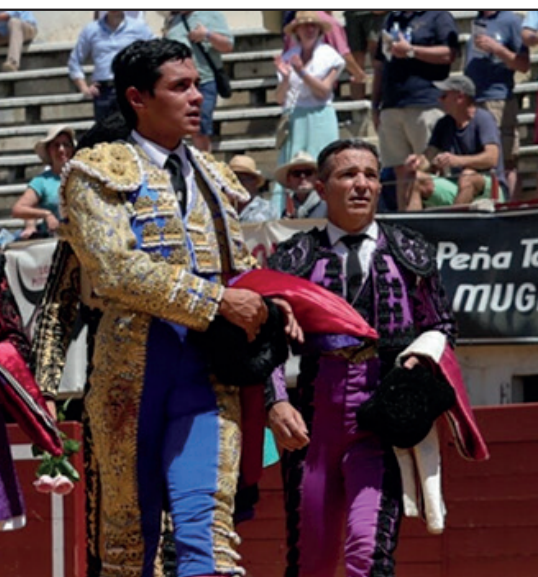
Pedro Luis, el sábado solitaria vuelta al ruedo en primera de Feria del Toro de Vic-Fezensac, Francia.

tuación muy entregada y de verdad, dejando los momentos de mayor calidad del festejo con su toreo al natural a pies juntos. Fue reconocido finalmente con una vuelta al ruedo".