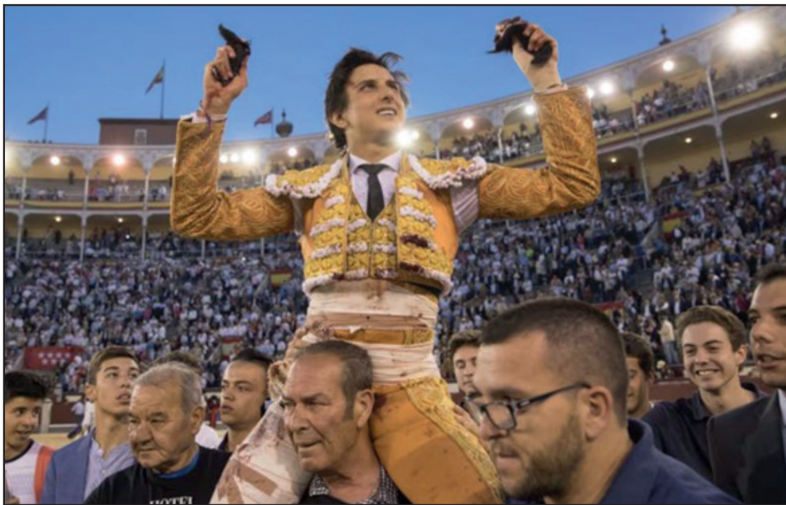
Andrés Roca Rey, el 22 de mayo del 2019 Puerta Grande en Las Ventas de Madrid. Anunciado en Corrida de la Prensa este jueves 28 de mayo.