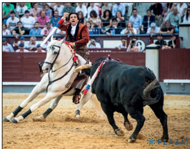
Diego Ventural, el sábado colocando banderilla en corrida de rejones, en décimo cuarto festejo de Feria de San Isidro en Las Ventas.

ANDY CARTAGENA Y DIEGO VENTURA OREJA EN DÉCIMA CUARTA DE FERIA SAN ISIDRO (ESPAÑA). 24 MAY.- Andy Cartagena y Diego Ventura han paseado una oreja en la primera cita de rejones de San Isidro celebrada hoy