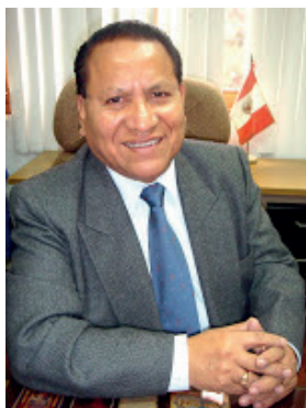
Escribe: José Casiano Collazos

Democracia exige equipos competentes en gestión y no personajes ideologizados, oportunistas por ambición.