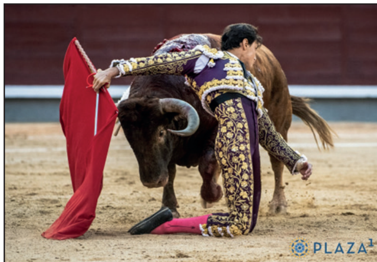
Andrés Roca Rey, ayer un pase cambiado por la espalda de hinojos en la Corrida de la Prensa en Las Ventas. Anunciado y esperado los días 27 y 28 de junio en Chota, Cajamarca.