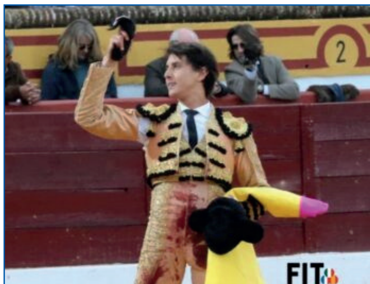
Andrés Roca Rey, el 3 de marzo 2024 oreja y vuelta al ruedo del primer toro de su lote en Olivenza. Vuelve el 8 de marzo a última de feria en Olivenza

las mismas columnas (sin modificarlas) columnas conocidas como "machones" (columnas o contrafuertes) y que se conservan originalmente construidas desde 1765 en barro y caña, esta vez la nueva capacidad de la plaza se había ampliado aproximadamente para 13,300 personas.