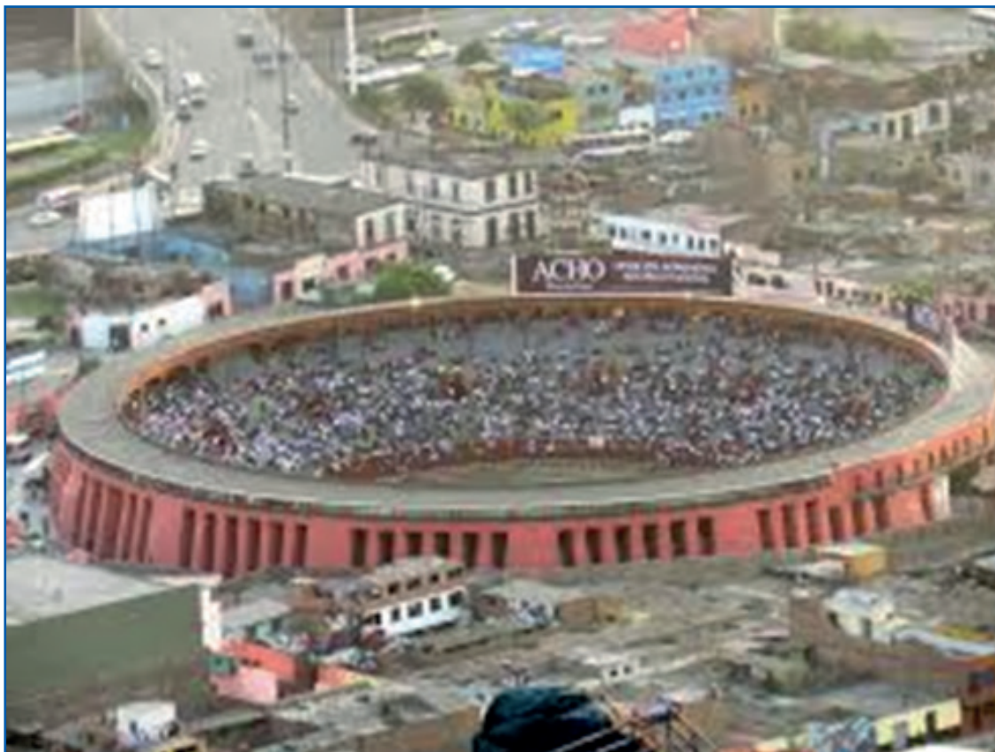
Plaza de toros Acho, hoy cumple 260 años de historia, arte y tradición ¡Enhorabuena!

administrada por la Junta Real de Beneficencia de Lima (actualmente forma parte del patrimonio de Sociedad de Beneficencia de Lima Metropolitana, propietaria de la Plaza de Acho), para su explotación a favor de dicho hospicio. La entidad propietaria del coso taurino limeño procedió a sacar a remate la explotación de dicho inmueble, siendo el primer asistente don José Antonio Morote. La antigua y vieja Plaza de Toros de Lima "Plaza de Acho" sufrió tres grandes modificaciones: la primera en 1865, denominada de "refacción", con motivo de prepararla para la celebración de su centenario; la segunda y la más importante en 1944, denominada la "remodelación" a cargo de la Sociedad Explotadora de Acho, de común acuerdo con la Sociedad de Beneficencia Pública de Lima (nombre anterior que llevaba la propietaria del viejo coso rimenense); y por último las obras realizadas en el año de 1961, a la que se ha denominado "ampliación", el área de la plaza se incrementó con los grandes patios de ingreso, formando atrios, pérgolas y explanadas, así como la edificación de un restaurante, dos bares y un Museo Taurino. La anti-